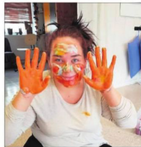
KREATIVITET: Ved Skogn Folkehøgskole får elevene ta i bruk kreativiteten. Bildet er fra en time hvor de malte med kroppen.