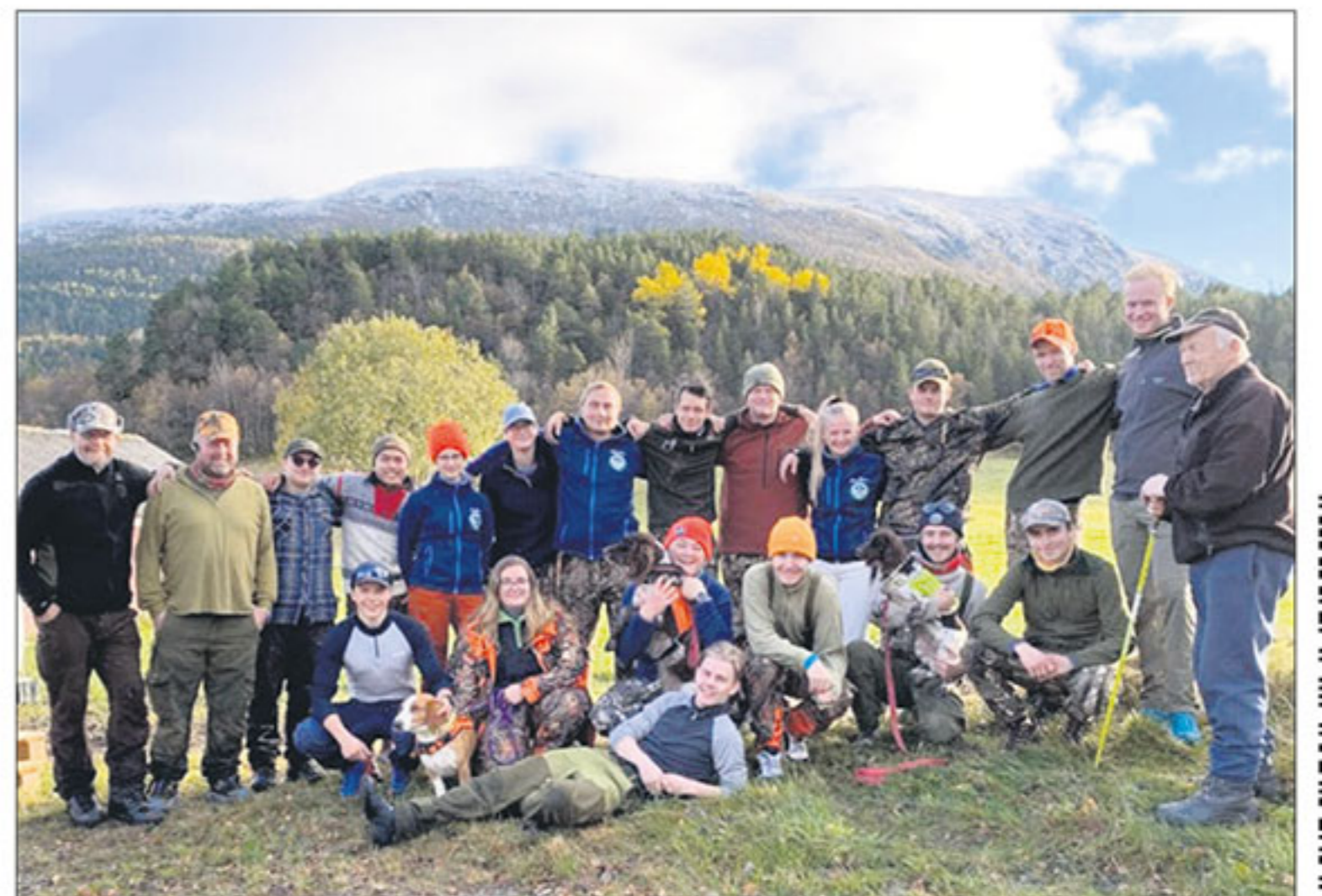
BESØK: Medelever fikk oppleve lokal kultur og elgjakt i Trysil.