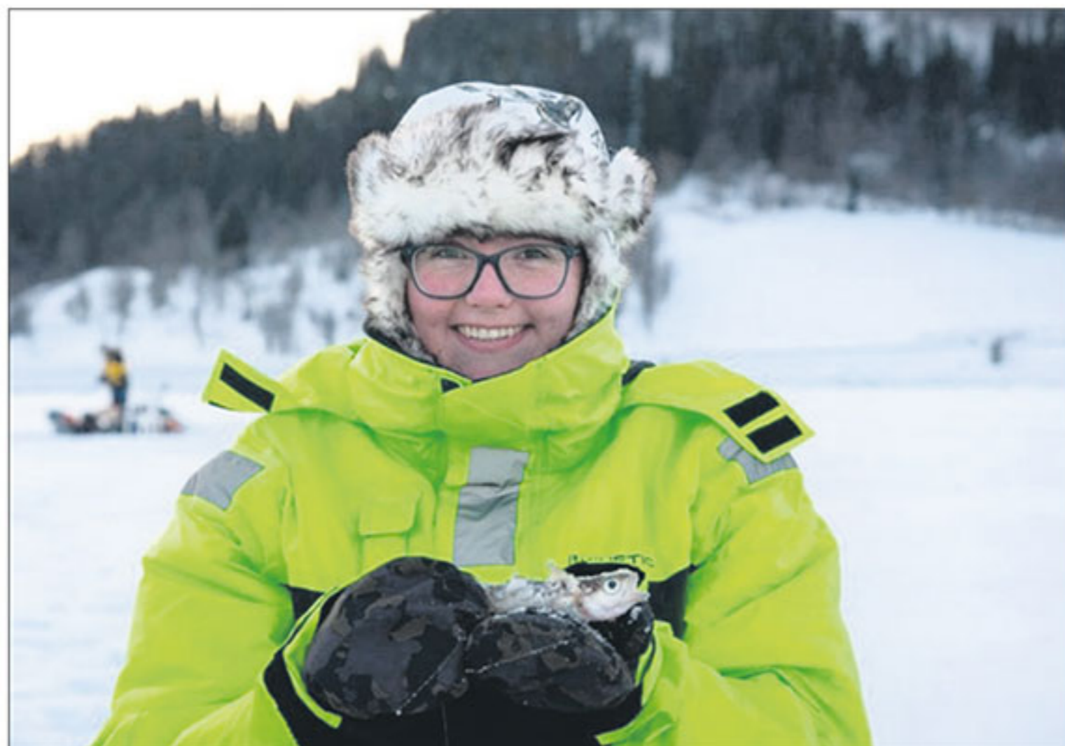
VINTERFISKE: Med gode klær er vinterfiske en fornøyelse også.